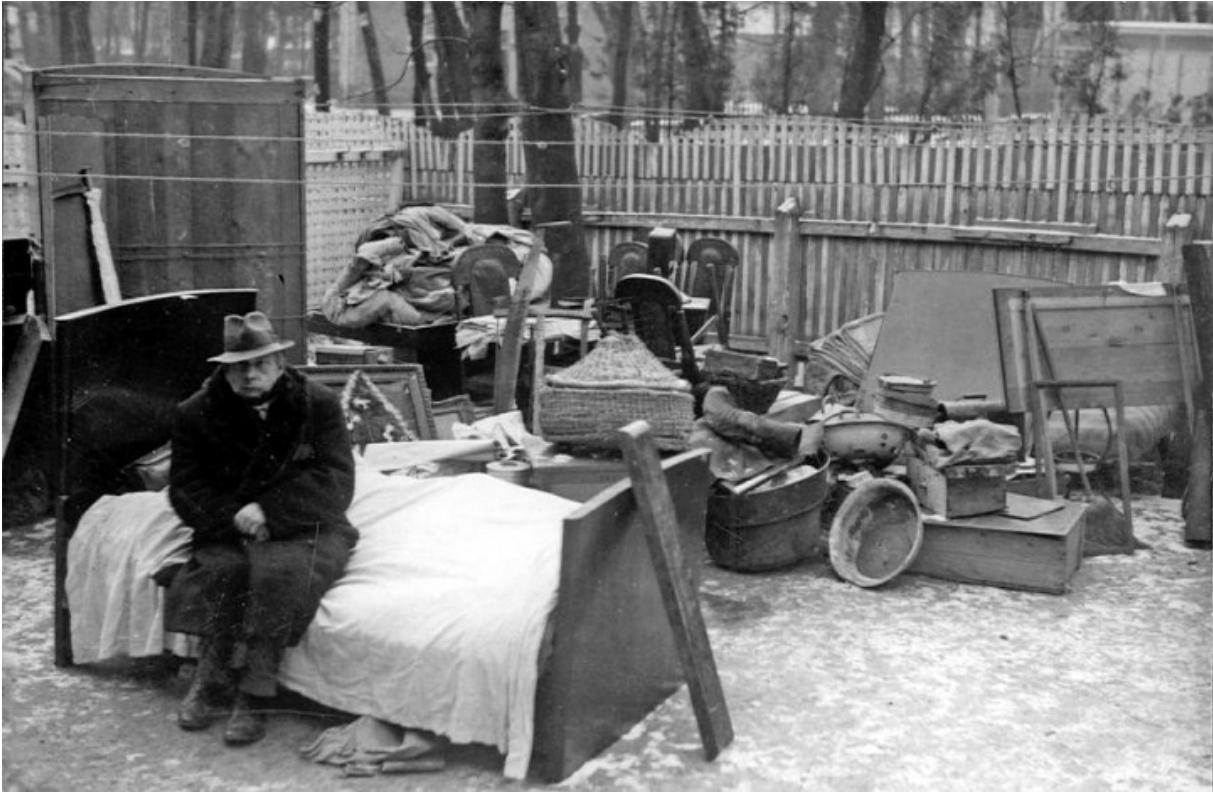
Бездомный на улице гетто Будапешта

По другой версии, решающую роль в спасении гетто сыграл итальянский бизнесмен Джорджио Перласка, выдававший себя за генерального консула Испании. Он добился встречи с министром внутренних дел Габором Вайна и пригрозил ему, что если гетто будет уничтожено, то пострадают все венгерские граждане, оказавшиеся в Испании и нескольких латиноамериканских странах. Вполне возможно, что обе версии реальны. К этому моменту в гетто оставалось около 70 000 узников.