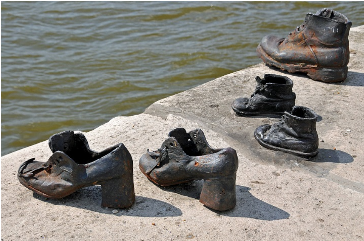
«Туфли на набережной Дуная» - мемориал памяти евреев, расстрелянных активистами «Скрещённых стрел»