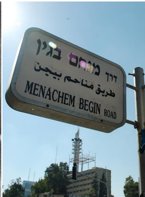
Проспект им. Бегина, Тель-Авив