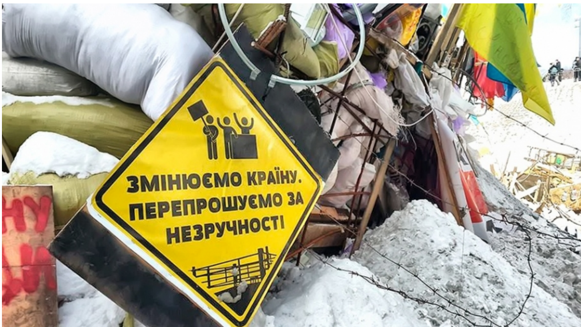
Революция достоинства, 2014

— Есть вероятность того, что будут попытки ревизии политического курса, попытки опять привязать Украину к российской сфере влияния, будут разочарования и кризисы... Рождение украинской политической нации — свершившийся факт, но на кого будет ориентироваться эта нация, — еще вопрос. Мы получили окно возможностей, когда большая часть населения, голосовавшая за пророссийские силы, исключена из электорального процесса благодаря российской оккупации. Но когда территориальная целостность будет восстановлена, то может восстановиться и электоральное равновесие между частью общества, которое хочет в Европу, и той его частью, которая тяготеет к России. Это равновесие всегда было губительным для Украины.