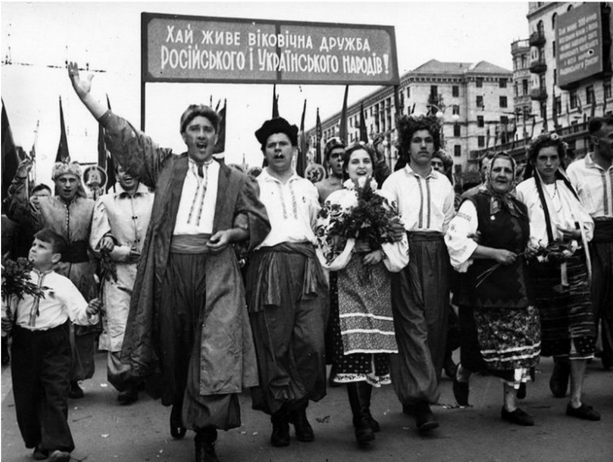
Первомайская демонстрация в Киеве, 1954 год

— Безусловно. Но — в отличие от норвежцев (они вообще арийцы) и финнов — мы в специфической ситуации. Финнов не угоняли на принудительные работы в Германию, не расстреливали заложников и не сжигали финские села. Не уверен, что всем украинцам приятно ходить по улицам имени человека, носившего форму страны, официально считавшей их народ унтерменшами — низшей расой. Это не унижительно для 40-миллионного европейского народа?