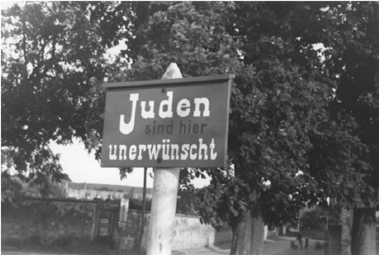
«Евреи нежелательны», Германия, 1930-е

Возмущался перспективой «Нацистских игр» американец немецкого происхождения Эрнест Ли Янке, член МОК, бывший замминистра ВМФ США, направивший президенту МОК бельгийскому графу Анри де Байле-Латуру открытое письмо. В ответ за месяц до Олимпиады МОК... исключил Янке, а его место занял Брендедж.