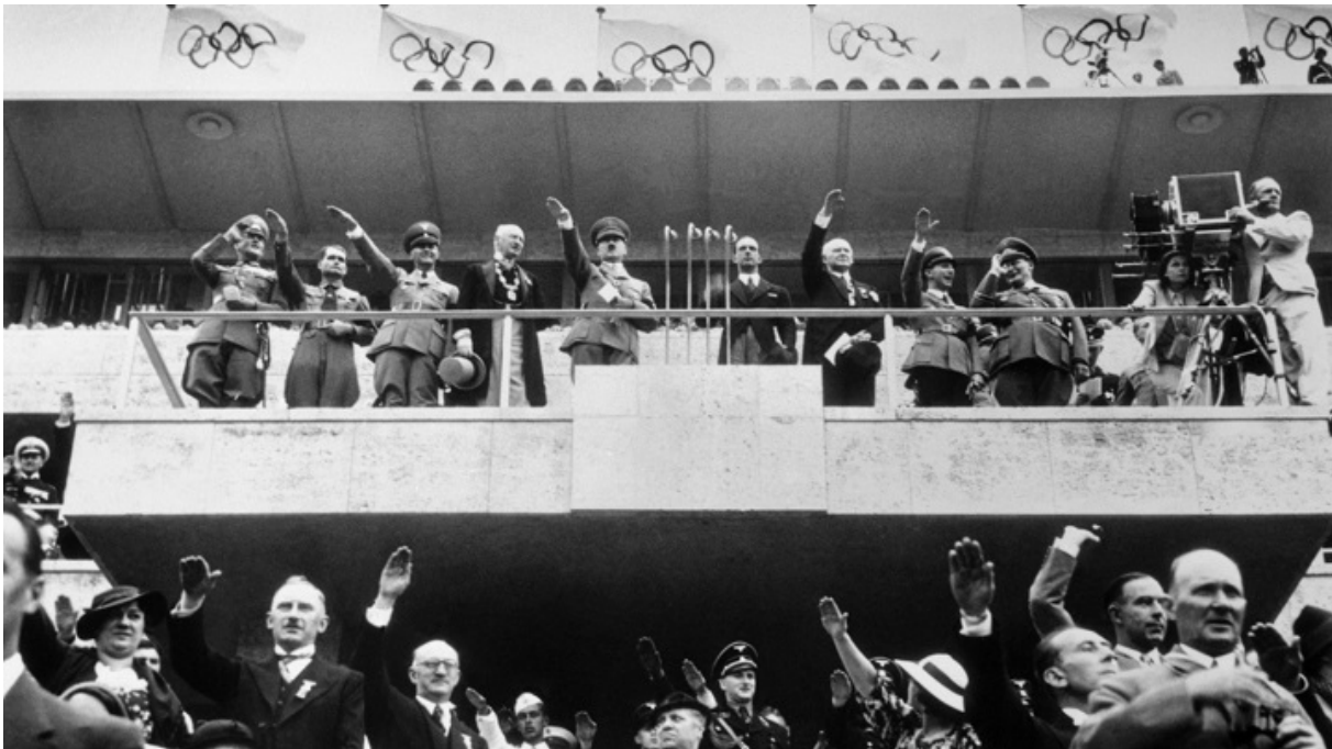
Руководство НСДАП на олимпийской трибуне

По подсчетам историков, спортсмены с еврейскими корнями из Венгрии, Австрии, Польши, США, Канады, Бельгии на летней и зимней Олимпиадах-1936 в психологически тяжелейших условиях на фоне флагов со свастикой завоевали 17 медалей, в том числе девять золотых.