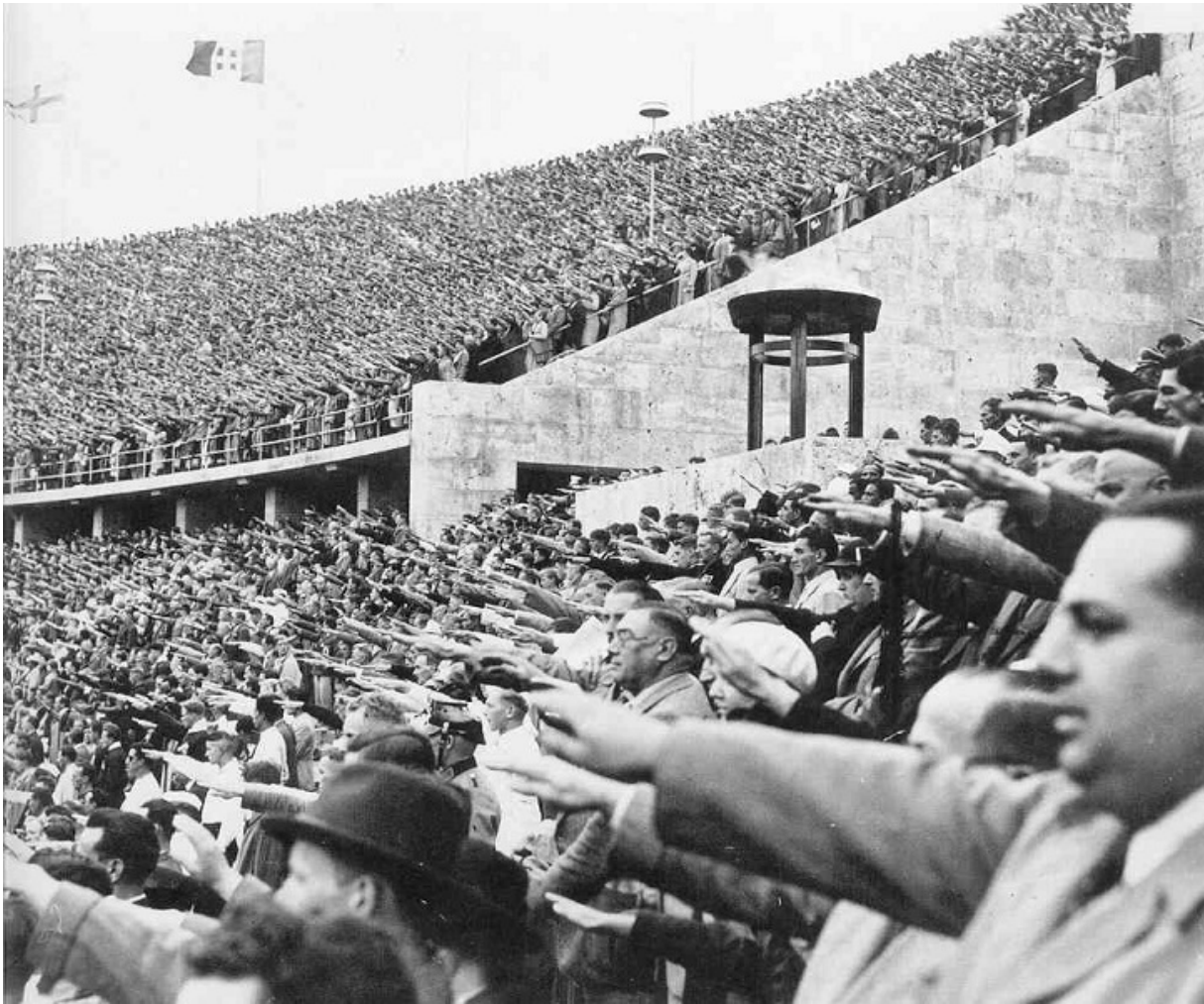
На олимпийском стадионе, Берлин, 1936

В конце 1920-х претендентов на проведение XI летних Олимпийских игр было предостаточно, но выбор Международного олимпийского комитета (МОК) пал на Берлин. Аргументы: возвращение Германии в мировое сообщество после поражения в Первой мировой; в Берлине должна была пройти Олимпиада-1916, отмененная из-за войны.