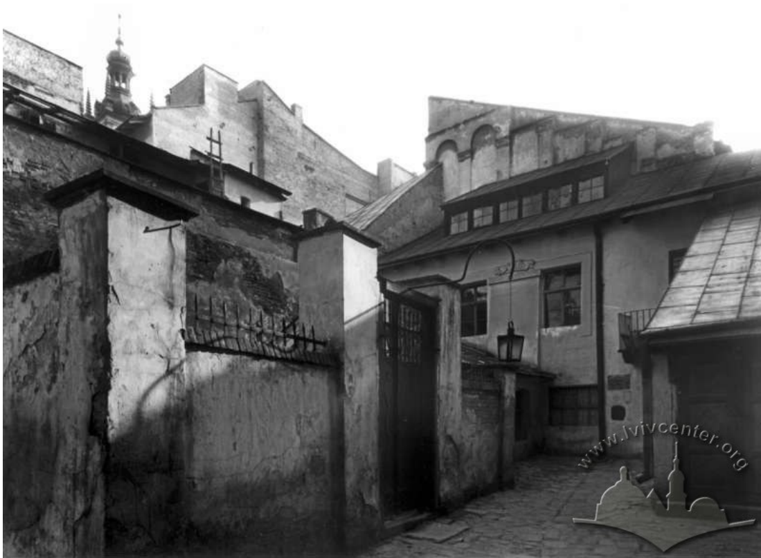
Двор синагоги «Золотая Роза», 1910-е