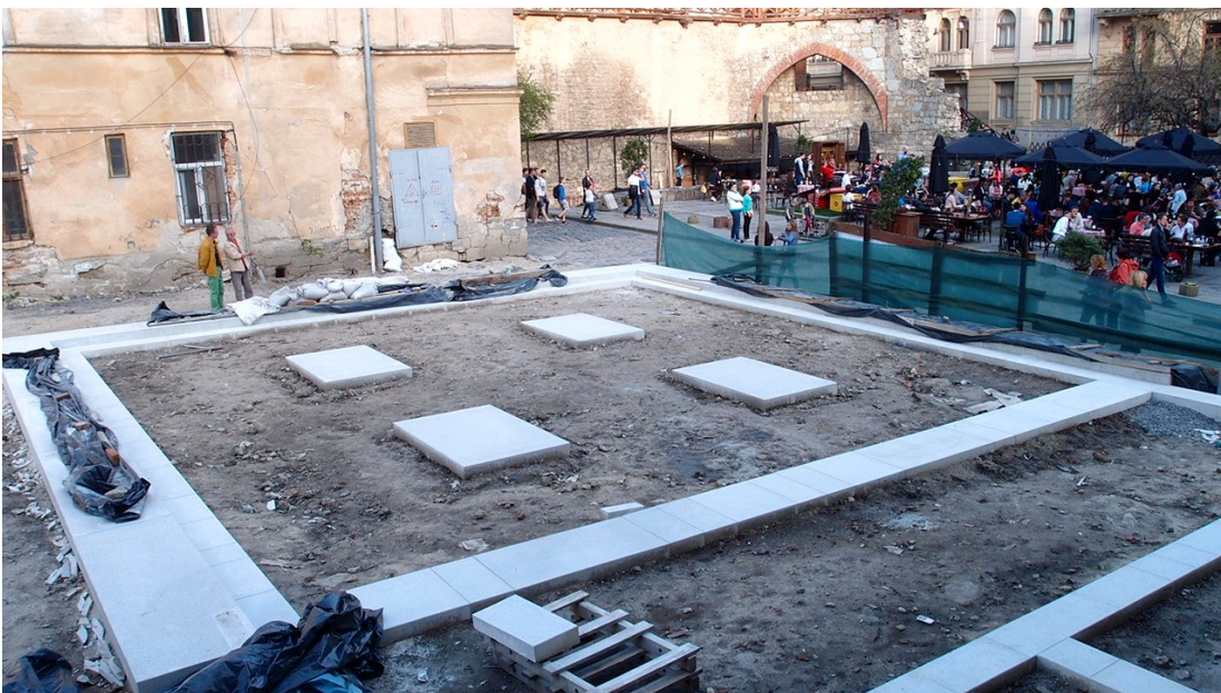
Консервационные работы на территории синагоги, 2016

4. Автор пишет о небрежности по отношению к сакральным с точки зрения