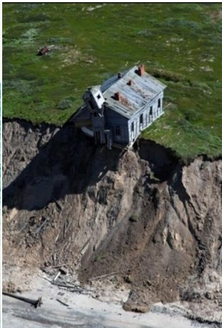
Остров Моржовец.