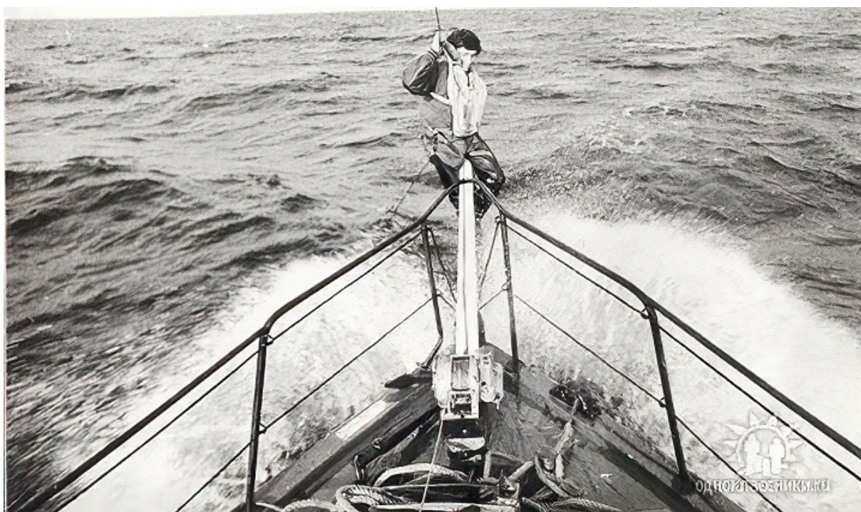
Борис Аронс на борту яхты, Баренцево море