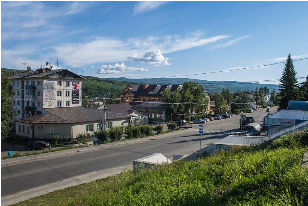
Главная улица Бодайбо