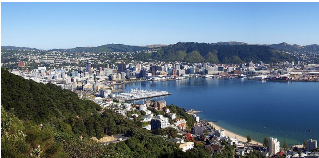
Панорама сучасного Веллінгтона

Я говорив довго. Розповідав про євреїв по всьому світу. Про наше життя — в Америці, в інших країнах, наскільки мені це було відомо. Розповідав про нашу літературу, та про наших письменників.