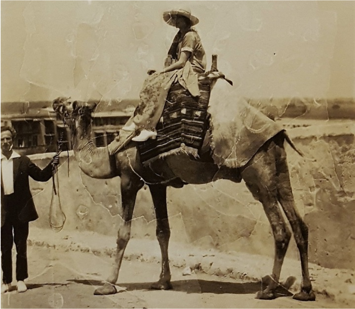
Перець Гіршбейн з дружиною - Естер Шумячер в Індії, 1927

Влітку 1929 року в Держвидаві України в Харкові побачила світ невеличка збірка дорожніх нотаток «Навколо світу» єврейського письменника з Америки Переця Гіршбейна. Написані їдишем нотатки переклав талановитий перекладач Ефраїм Райцин, якому в майбутньому судилося стати однією з центральних фігур їдиш-українського літературного діалогу. Основою для перекладу послужила книга Гіршбейна «Ібер дер велт» («Навколо світу»), що вийшла у Нью-Йорку в 1927 році, присвячена його подорожі разом з дружиною, поетесою Естер Шумячер, у 1920-22 роках тихоокеанськими островами (Таїті, Острови Кука, Нова Зеландія), Австралією та Південною Африкою.