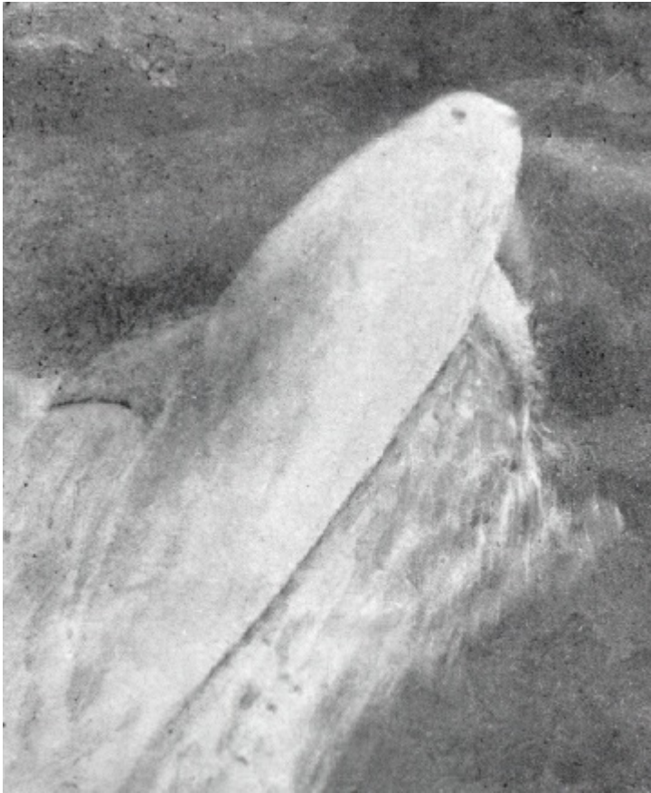
Пелорус Джек, фото 1909 року