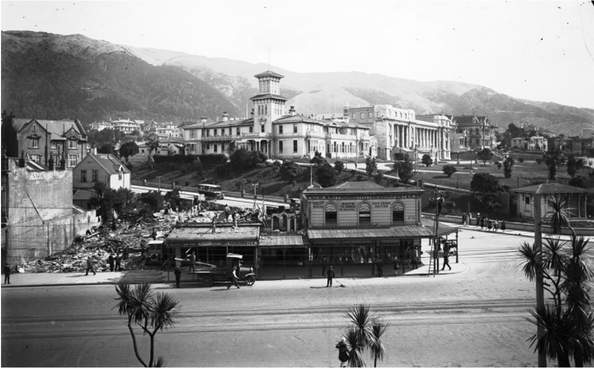
Центр Веллінгтона, 1929

Добрий дельфін, що жив у водах біля Нової Зеландії, був дороговказом для чужих пароплавів, танцюючи поперед пароплавів, як відданий собака, — можливо, його зовсім і не вбили норвезькі рибалки.