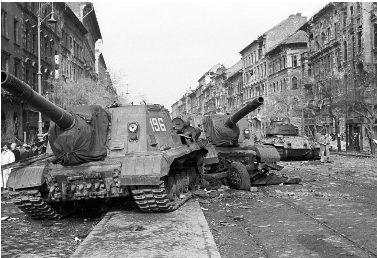
Радянські САУ на вулицях Будапешта, 1956