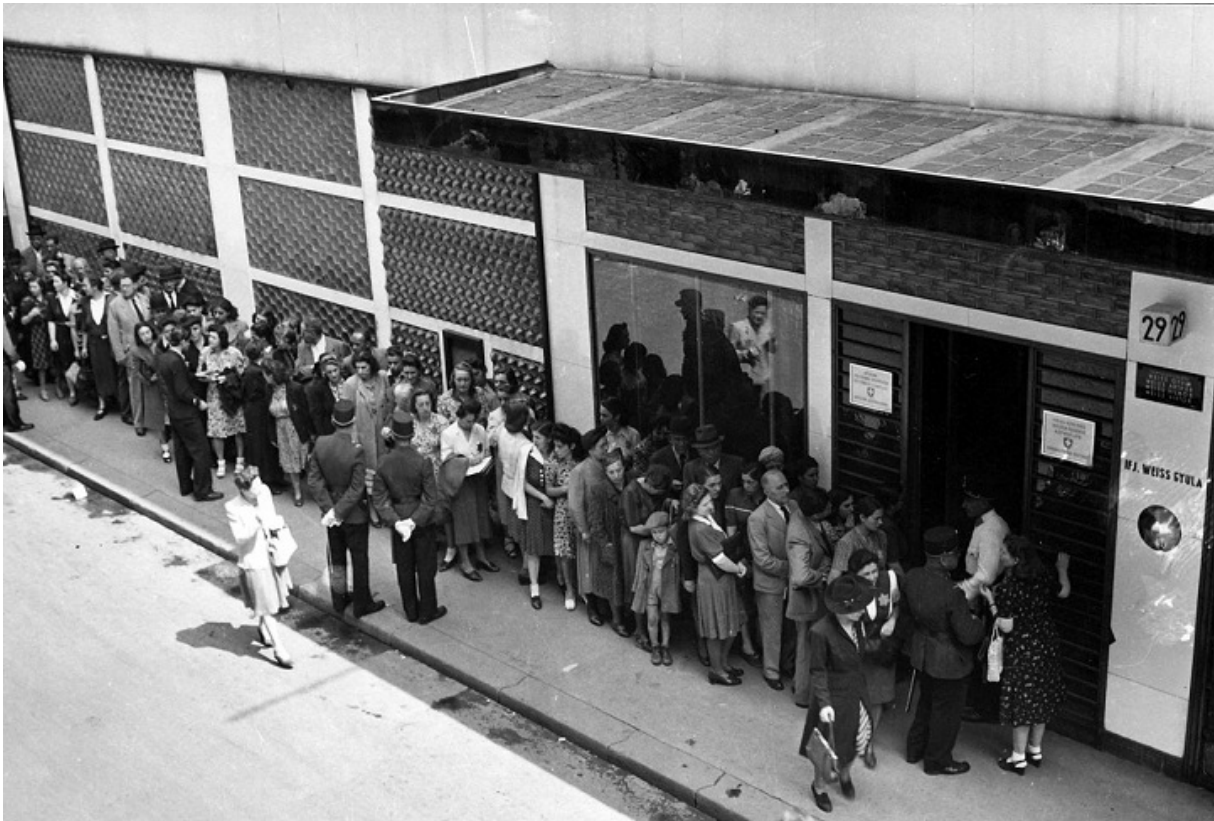
Черга з євреїв-прохачів притулку, Будапешт, 1944