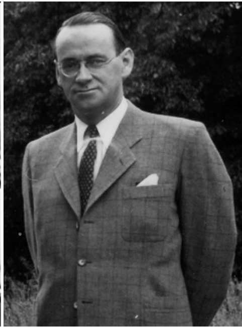
Консул Швейцарії у Будапешті Карл Лутц