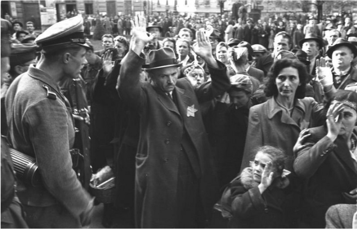
Oktober 1944

Масові арешти євреїв в Будапешті.