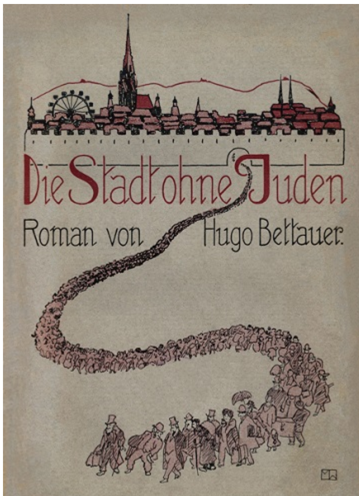
Обкладинка роману Хуго Беттауера «Місто без євреїв»

Сюжет головної книги Беттауера вельми простий. У Відні приходить до влади Християнсько-соціальна партія, лідер якої д-р Швердтфегер стає мером міста. Неполюбляючи євреїв, він проводить закон про вигнання всіх євреїв із Відня. Здебільшого жителі підтримують ініціативу, але нова реальність їх аж ніяк не радує. Завмирає культурне життя, у театрах нема чого дивитися. Спорожнілі кафе перепрофільовані під пивні бари. Економіка на спаді, багато бізнесів переїжджають у Прагу й Будапешт, зростає інфляція й безробіття. Страждають навіть політики, адже тепер нема на кого валити провину за всі свої прорахунки.