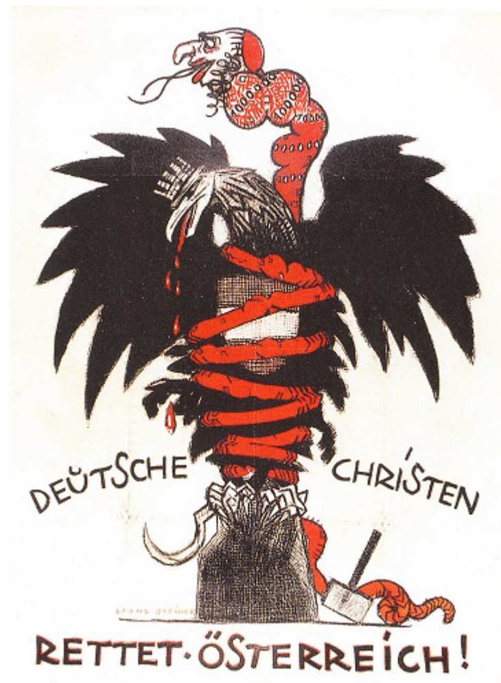
Антисемітський передвиборний плакат Християнсько-соціальної партії, 1920