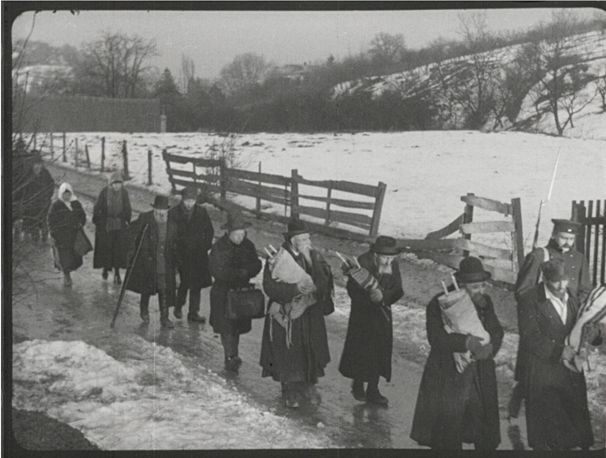
Кадр з фільму «Місто без євреїв»

Майже сто років тому — в 1922 році — з-під пера відомого австрійського письменника Хуго Беттауера вийшов роман під назвою «Місто без євреїв». Цей син львівського біржового маклера в 18 років полишив юдаїзм заради майже нездійсненої для єврея мрії — потрапити в бригаду гірських стрільців і зробити блискучу військову кар'єру.