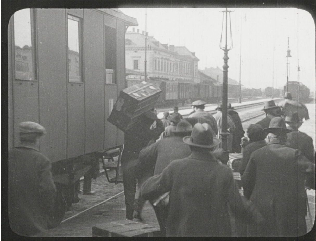
Кадр з фільму «Місто без євреїв»

І книга, і фільм виявилися частково пророчими. До кінця 1930-х Відень дійсно став містом без євреїв, чому багато місцевих жителів були вельми раді. Після війни в столицю Австрії повернулися лічені особи, із тих 200 000 євреїв, що жили там до аншлюсу.