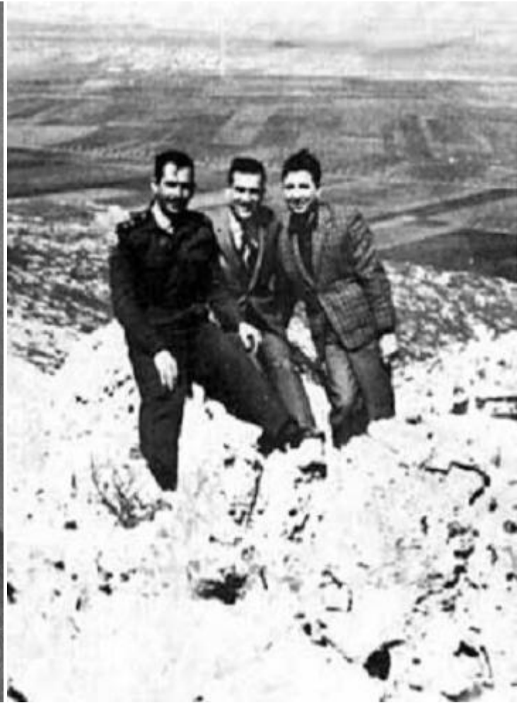
Коен (в центрі) під час відвідин Голанських висот

Разом із другом — військовим пілотом аль-Джабі — він відвідував закриту зону на кордоні з Ізраїлем, де оглядав укріплення на Голанських висотах. Йому навіть дозволяли фотографувати військові об'єкти та показували секретні карти з позначенням артилерійських складів, мінних полів і т. ін. Передана ним на батьківщину інформація значною мірою сприяла перемозі єврейської держави в Шестиденній війні.