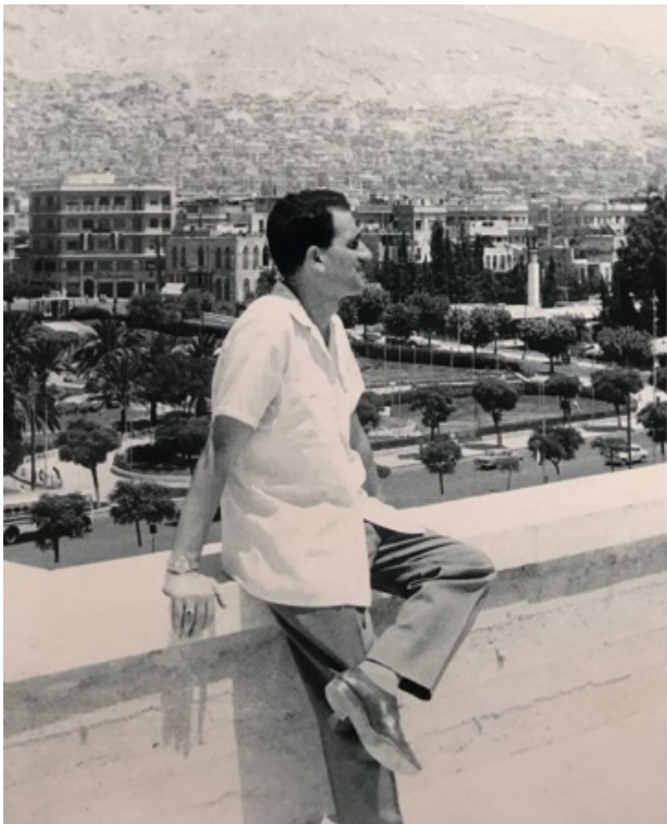
Елі Коен на фоні Дамаска