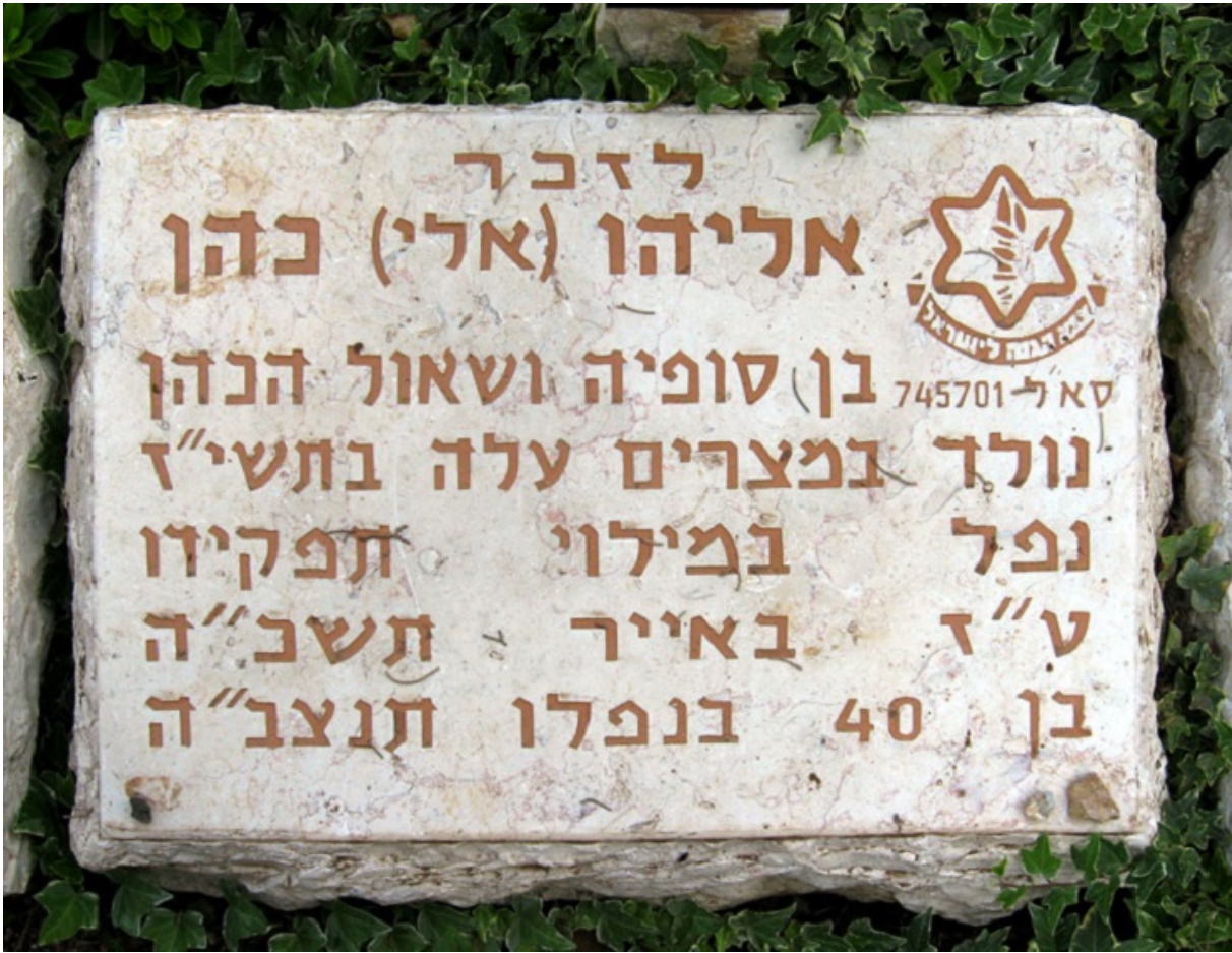
Плита в пам'ять про Елі Коена на горі Герцля в Єрусалимі

П'ять років по тому ізраїльтяни спробували викрасти тіло Коена, але безуспішно. Подальші версії про місцезнаходження останків розходяться. Брат Елі (теж співробітник Моссаду) — Моше Морріс Коен — озвучив деякі з них кілька років тому. Так, є відомості, що президент аль-Хафез помістив тіло розвідника в бункер під охорону цілого батальйону, а наступний президент Сирії викопав останки, спалив їх, а могилу залив бетоном. Але це, повторимо, непідтверджені дані.