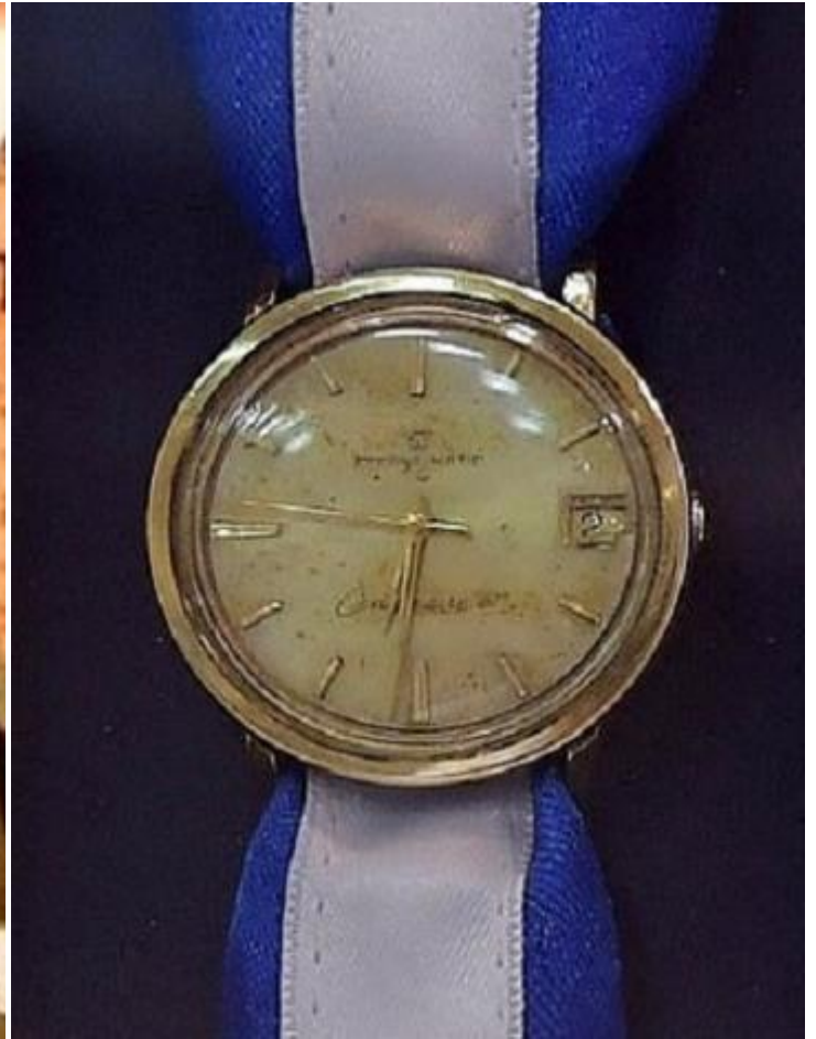
Годинник Елі Коена, який повернули родині в 2018 році

Лише після цього прем'єр-міністр Нетаньягу визнав, що в Сирії ведуться пошуки останків легендарного агента Моссада, відмовившись коментувати повідомлення про предмет, нібито переданий в Ізраїль. «Я зобов'язаний повернути додому всіх полеглих або зниклих безвісти, — підкреслив прем'єр. — Ми повернули до Ізраїлю останки Захарії Баумеля (сержант ЦАГАЛу, загинув у бою із сирійцями в Султан-Якуб у 1982 році, — М.С.). Це вдалося зробити завдяки моїм тісним зв'язкам із президентом Путіним, який відправив своїх військових у місце, на яке вказувала наша розвідка. І ми продовжуємо докладати зусиль для того, аби повернути Елі Коена і всіх інших».