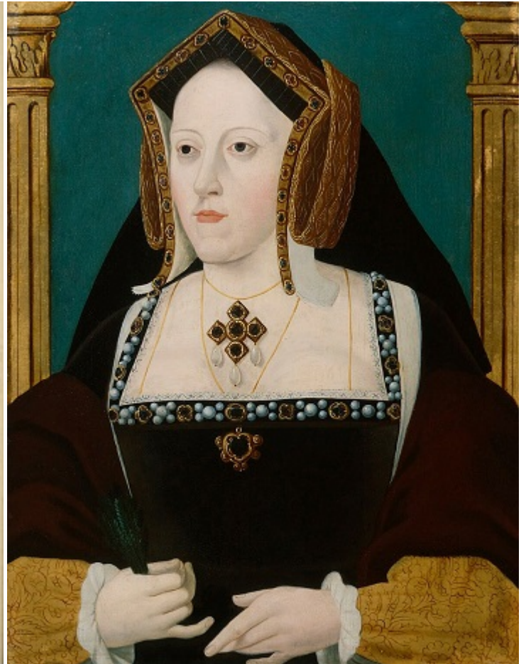
Портрет Екатерины Арагонской, около 1525 г.

Потенційна лазівка була знайдена в Біблії, де в Книзі Левіт міститься заборона вступати у зв'язок із вдовою брата. Свого часу Папа Римський дав Генріху VIII особливий дозвіл одружитися на Катерині, але зараз королю було потрібно інше рішення, і він вирішив спробувати щастя у євреїв. Зробити це було непросто, оскільки ще у 1290 році декрет Едуарда I приписав усім євреям покинути межі Британських островів.