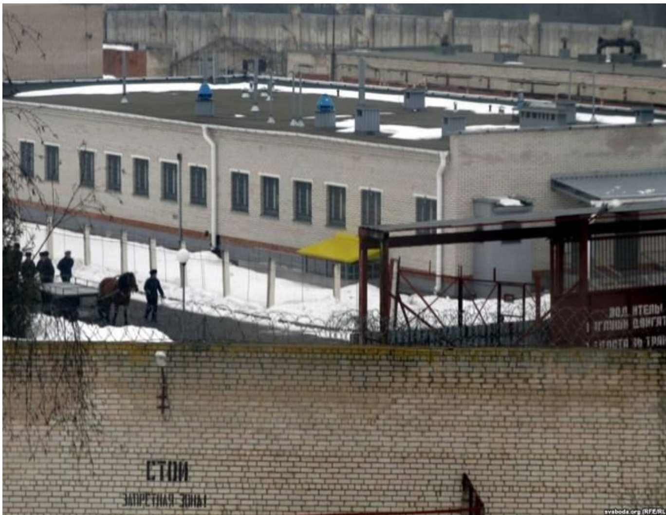
Жодинская тюрьма №8.

Марина поехала в Жодино, где с родственниками других арестованных ночевала прямо в поле перед тюрьмой. В одних волонтерских палатках была еда и питье, в других врачи принимали изуродованных освобожденных и оказывали им первую помощь. В палатках с одеждой была отдельная сумка со шнурками и ремнями — у заключенных отбирали эти вещи, чтобы они не повесились. Психологи тут же на месте обучали волонтеров, как оказывать первую помощь выходящим из тюрьмы — ни в коем случае не прикасаться, так как потерпевший может быть ранен и это чревато шоком. Одна мать, увидевшая выходящего из тюрьмы сына, у которого была сломана рука и торчала кость, упала в обморок.