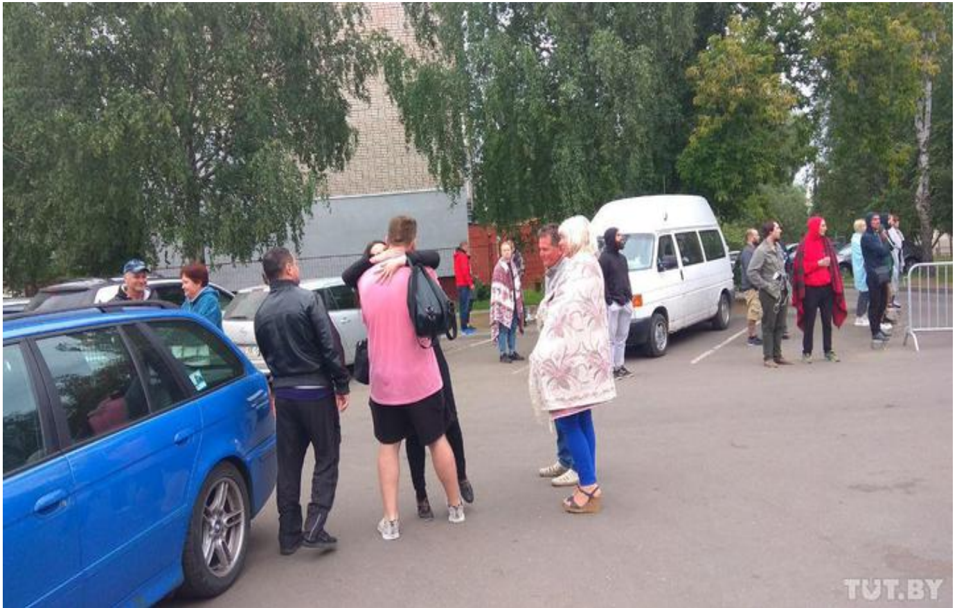
Освобождение задержанных из изолятора в Жодино.

Протокол обвинения был заранее подготовлен на нескольких листах. Текст прочитать не дали. Саша все подписал.