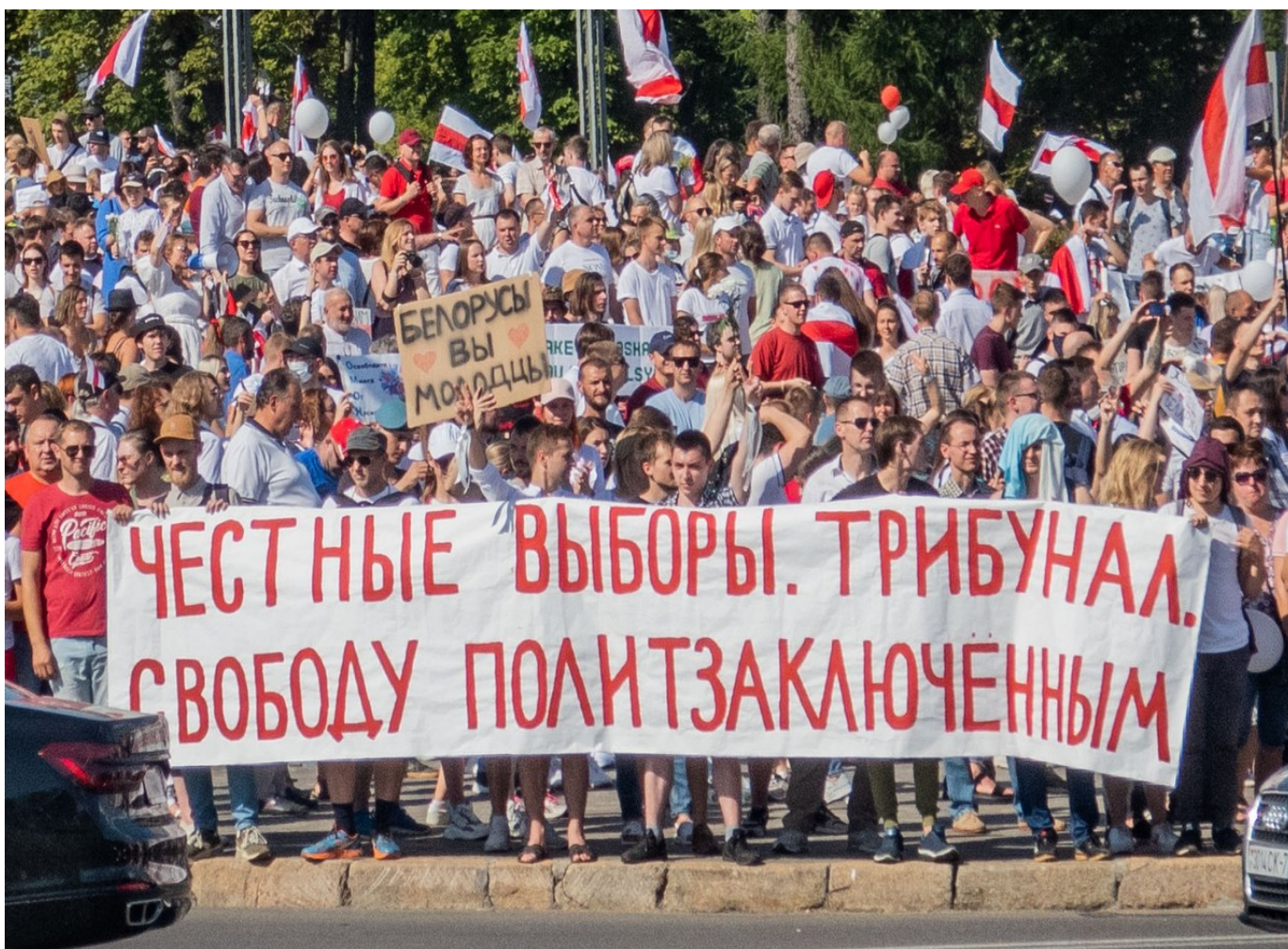
Протесты 16 августа 2020 года

Мирные протесты начались по всей стране. Никто не бьет витрины, не сжигает машины. Ответом на это стали аресты на улицах, причем не только демонстрантов, но и случайных прохожих, пытки, изнасилования, издевательства и жестокие избиения в тюрьмах. Участники демонстраций показывают свои изувеченные тела, сплошь покрытые кровоподтеками. Задержаны более семи тысяч человек, 70 пропали без вести, социальные сети полны свидетельств о беспределе садистов, диагноз которым должен поставить психиатр, а суд определить меру наказания.