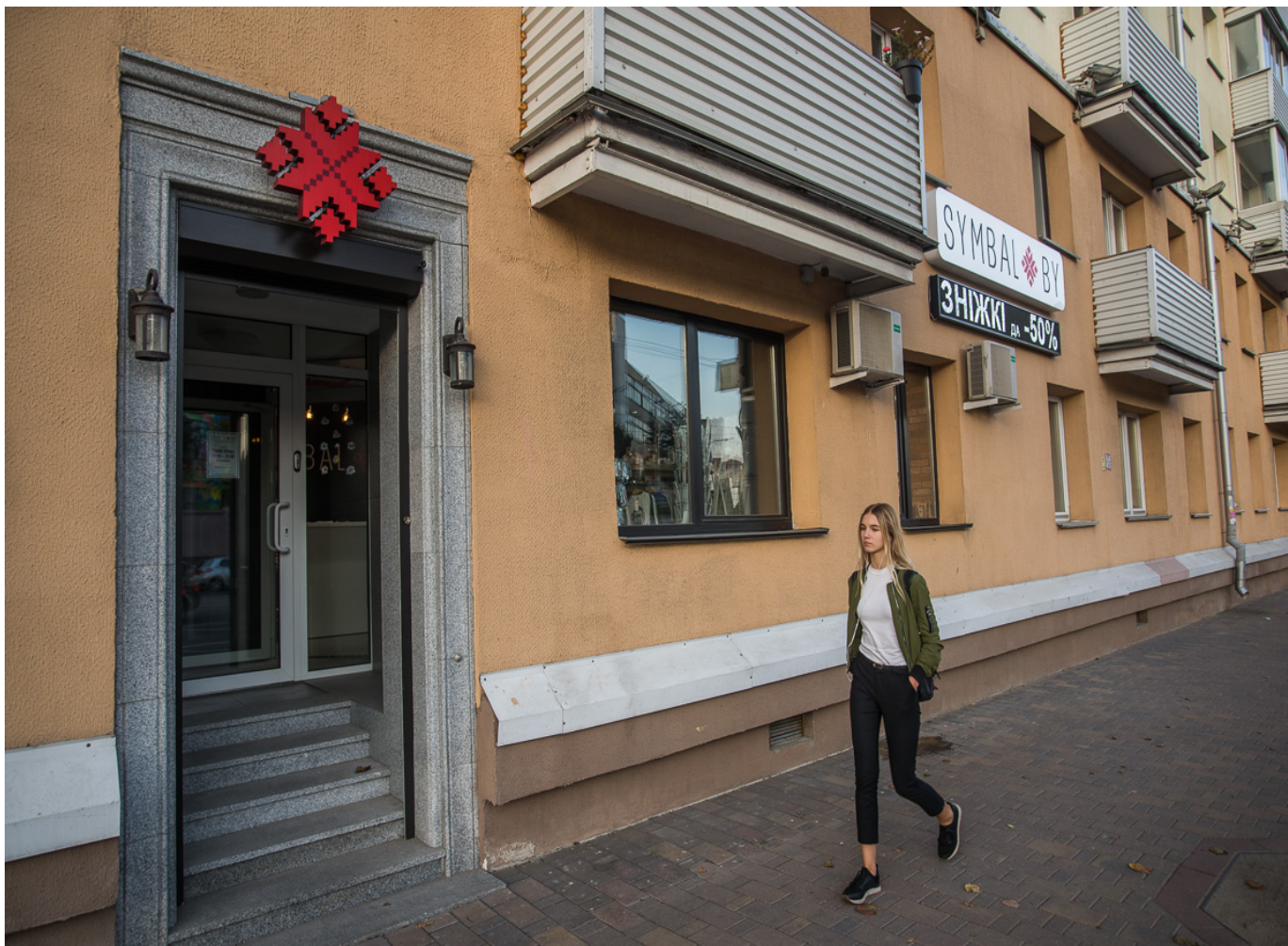
Вход в магазин Symbal.by