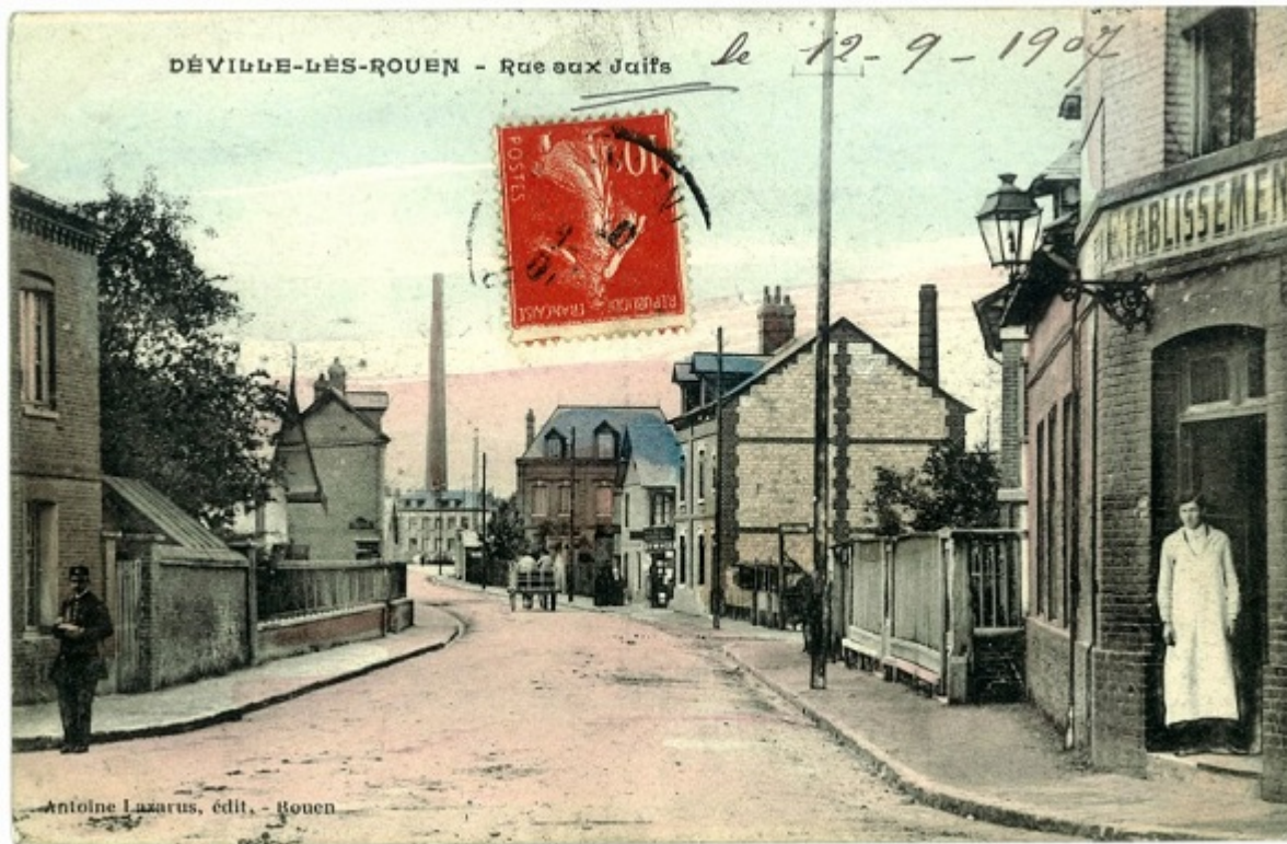
Еврейская улица Руана, старая открытка

Когда Филипп Красивый изгнал евреев из Франции в 1306 году, еврейский квартал Руана стал собственностью города и был превращен в овощной рынок, хотя по сей день вдоль него проходит Rue aux Juifs.